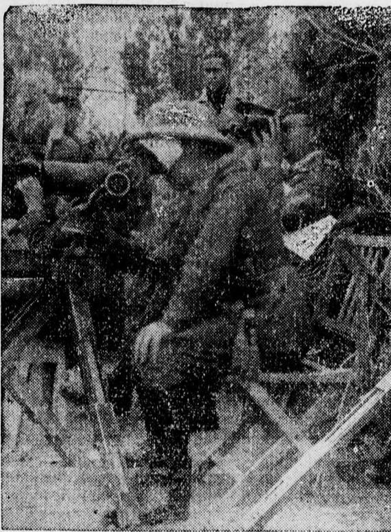
Franco tábornok az Ebro-fronton figyel a nemzeti csapatok sikeres operációját.