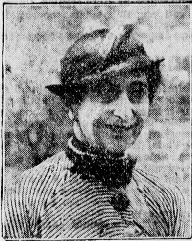
Maud norvég királynő 69 éves korában egyik előkelő londoni szanatóriumban meghalt. Ez az utolsó fénykép az elhunyt királynőről.

EGY MÁRMAROSSZIGETI FAVÁLLALAT DIPLOMÁCIÁI ÚTON PRÓBALJA VISSZASZEREZNI MUNKÁCSON REKEDT GÉPKOCSIJÁT. Maramarosszigetről jelentik: A Csehszlovákiában történt határváltozások miatt diplomáciai eljárás közepontjába került az Arbor favállalat tehérgépkocsija. Még a területi változásokat megelőzően a cég kocsija Munkácsra ment. A határkiigazítás idején a Hlinka-gárda kezébe került a gépkocsi, amely a magyar csapatok: Munkácsra való bevonulásával Magyarországnak jutott. A cég most diplomáciai úton igyekszik elismertetni jogát a gépkocsira s visszazerezni azt.