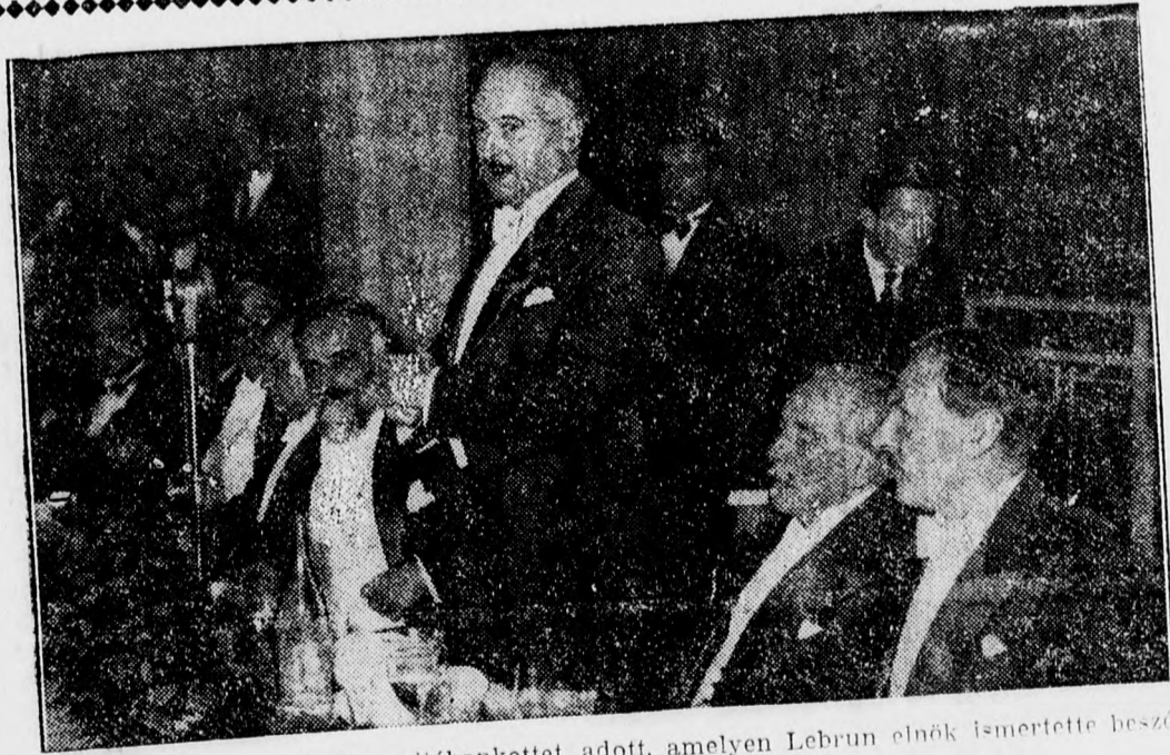
A francia köztársaság elnöke sajtóbankettet adott, amelyen Lebrun elnök ismertette beszédében a legújabb eseményeket

A párizsi vas- és fém munkások szövetsége felhívással fordult tagjaihoz, melyben arra hívja fel a figyelmet, hogy ne kezdjenek elsietett sztrájkmozgalmat. Ülést tartott a francia munkaadók szövetsége is s ezen megállapította, hogy a mostani sztrájkmozgalom nem bérhárc, hanem a Reynaud-féle törvényrendelettel szemben a szélső baloldaliak harca az ország fölötti hatalom elvitatásáért.