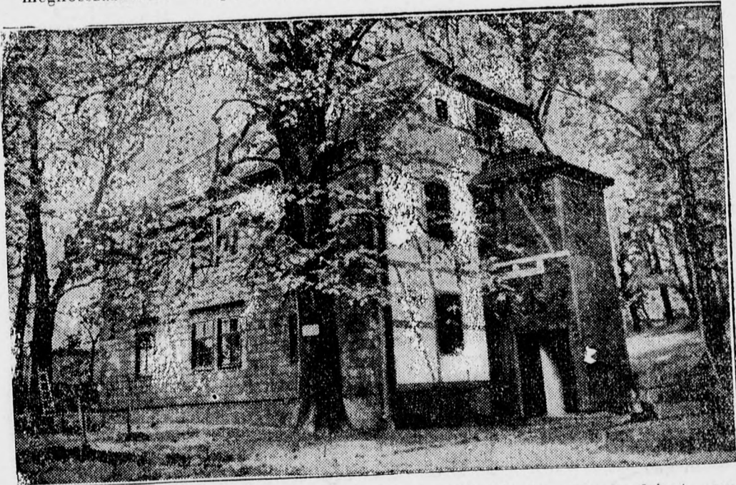
Az elmúlt évben Magdeburg városa Lengyelországnak ajándékozta azt a házat, amelyben Pilsudski marsall élt internálása idején, a háború alatt. Az épületet Magdeburgban lebontták és víziúton az Elbe folyón, az Eszaki-tengeren, a kielii csatornán és a Vistulán át, Varsóba szállították, ahol újra felépítették.

Harmadszor: Mindkét kormány egyetért annak szükségességében, hogy az időszerű kérdéseket oly pozitív megoldásokhoz kell juttatni, melyek a fennálló szerződési viszonyokból folynak. De főképpen sürgősen elintézendők azok a kérdések, melyek a legutóbbi határc incidensekből kifolyólag még függőben és tárgyalás alatt vannak.