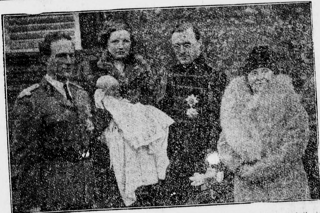
Lipót belga király meglátogatta kis keresztleányát Hollandiában. Képünkön balról jobbra: Lipót király, Julianna hollandi trónörökös, karjaiban a csöpp Beatrix hercegnővel, Bernhard herceg és Vilma, Hollandia királynője láthatók.

Ha a népünk közt észlelhető, elszomorító jelenségeket meg akarjuk szüntetni, ha templomainkat újra meg akarjuk tölteni minden jóra, nemesre kész hívó sereggel, ha erkölcsi és anyagi tekintetben virágzó népi életet akarunk teremteni — mely tudni és teljesíteni fogja köteleltségét templomával és iskolájával szemben —, akkor nincs más mód és eszköz, mint az, amely az 1936. évi marosvásárhelyi „Krisztus és a falu” jelige alatt lefolyó katolikus nagygyűlésnek is egyik vezető gondolata volt: az elmélyülő, kitartó, hatékony falumunka. Miben álljon ez: erről fogunk szólni a következő közleményben.