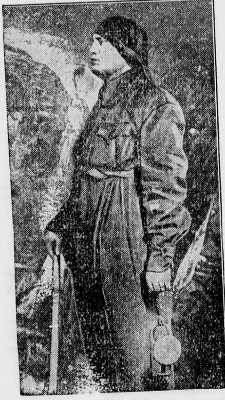
A római ásvány és autarkiai (önellátási) kiállítást Mussolini bányászruhában nyitotta meg, hogy ezzel is dokumentálja az olasz földkincesi kiaknázásának fontosságát.

Üngyilkos lett egy brassói mérnök felesége. Brassó. Saját tudósítónktól. Megdöbbentő öngyilkosság történt az itteni Metro-gyárban. Roda Andrei mérnök 33 éves felesége, férjének távollétében a fürdőszobában felakasztotta magát. Mire tettét észrevették, a szerencsétlen fiatal asszony már halott volt. Miután az életunt uriaszszony bucsulvelet nem hagyott hátra, az öngyilkosság okát homály fedi. Az ügyészség megadta a temetési engedélyt.