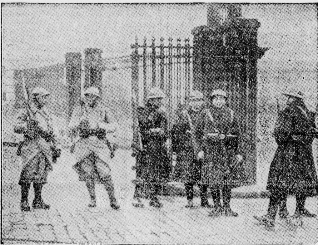
Katonaság őrzi Párizsban a pályaudvarokat, főleg azok raktárépületeit s a fűtőházak bejáratait.