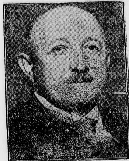
Beran, Cseh-Szlovákia új miniszterelnöke.

annak alibiét igazolni. A vádlott Skoblinné tiltakozott a vád ellen és ártatlanságát hangoztatta. Végül is a vád a kihallgatások után leszűródött s ennek alapján törvénytelen tartóztatás büntetében való részvétel címen helyezték vád alá véglegesen Skoblinné. Ezután az esküdszéki tárgyalást egy nappal elhalasztották.