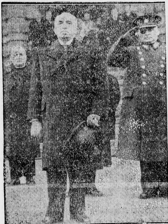
Dr. Emil Macha, cseh-szlovákia új köztársasági elnöke a megválasztás után. Hátamögött Malypetr (balra) és Sirovy (jobbra) láthatók.

Ugyanaz az egyszerű szellem a helyzet és a lehetőségek pontos ismerete, az intézkedéseknek az ország való helyzetének megfelelő alkalmazása, jellemzi a többségi elem támogatását is, amely máskülönben a jelenlegi kormányzat legfőbb irányelvét képezi.