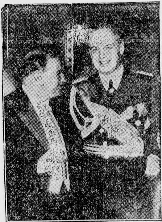
Daladier és Ribbentrop a párizsi tanácskozások után.

Pozsonyból jelentik: Stefanik szlovák tábornok rejtélyes halála csaknem két évtized után most élénken foglalkoztatja a szlovák közvéleményt. Stefanik, aki nagy szerepet játszott Csehszlovákia megteremtésében, 1919 május 4-ikén repülőgépen tért haza Olaszországból, hogy átvegye a hadügyi tárcát, de repülőgépe Pozsony felett állítólag viharba került, lezuhant és Stefanik meghalt. Szlovákiában arról suttogták, hogy Stefanik gépét prágai körök parancsára cseh csendőrök lőtték le gépfegyverrel. Az egyik szlovák lap most azt követeli, hogy derítsék ki az igazságot Stefanik halála körül, mert különös, hogy Benes, aki ellenséges viszonyban volt Stefanikkal, állami pénzzel, milliókért megvette az örökösöktől Stefanik feljegyzéseit és azokat a hősök emléksarnokában őrzik.