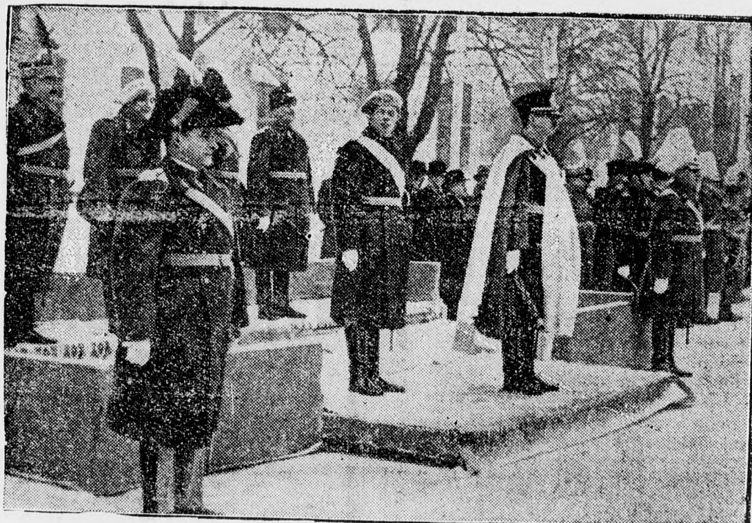
II. Károly király ünnepiesen felavatta az új tisztjelöltet, akik ezután elvonultak Őfelsége és a trónörökös elé.