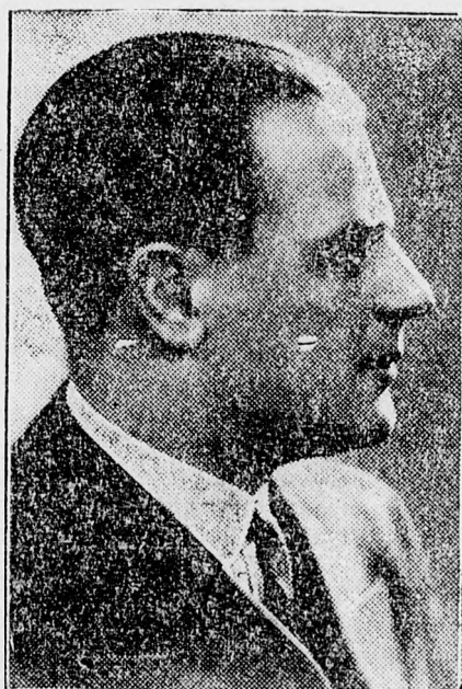
Gafencu Grigore, Románia új külügyminisztere

Ezek a megnyilatkozások azt jelentik, hogy a román külpolitika a Duna-medencében olyannyira szükséges szomszédi jóviszony megalapozása terén új ösvényekre lépett.