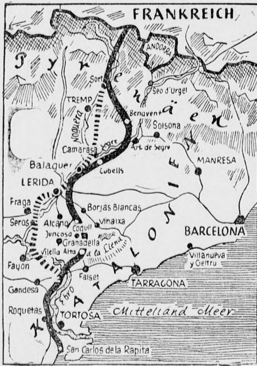
A spanyolországi harcok állását mutatja térképünk. A vastag vonal a nemzetiek előnyösülésének irányát jelzi.

Párizsból jelentik: A francia sajtó értesülése szerint Anglia hajlandó a szuezi-csatorna kérdésben engedelményt tenni Olaszországnak.