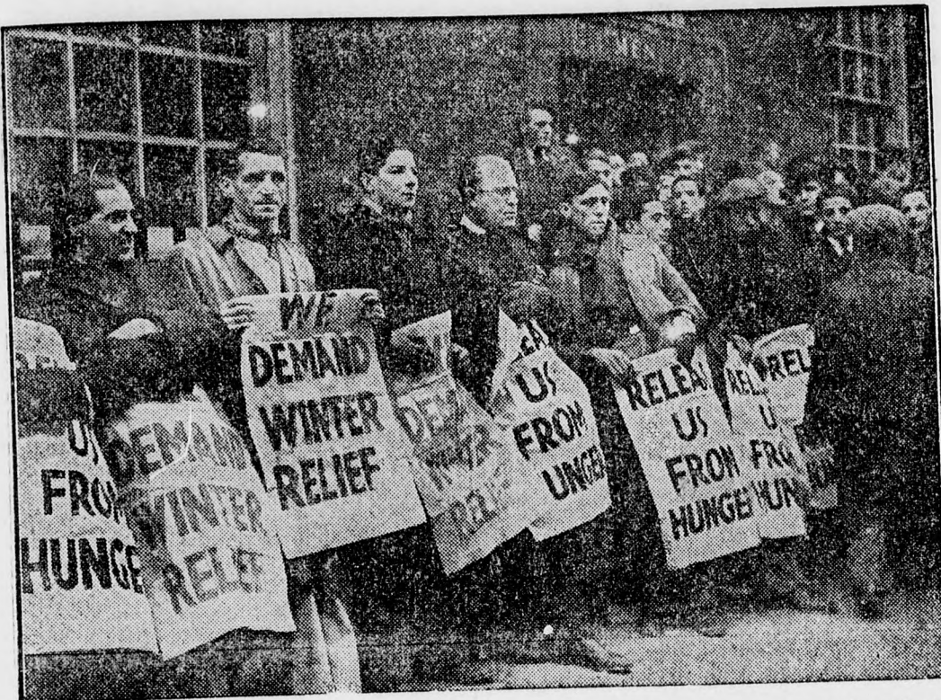
Londonban állandósultak a munkanélküliek tüntetése. Legutóbb egy csoport munkanélküli odaláncolta magát a munkaközvetítő hivatal rácskerítéséhez, hatalmas plakátokat tartva, amelyeken téli segélyt követelnek. A rendőrségnek valósággal le kellett fűrészelni a tüntetőkről a láncokat

Párizsból jelentik: Lebrun köztársasági elnök és felesége március hónapban adja vissza Londonban az angol királyi pár látogatását. Eddigi terv szerint a francia köztársasági elnök március 21-én érkezik meg Londonba.