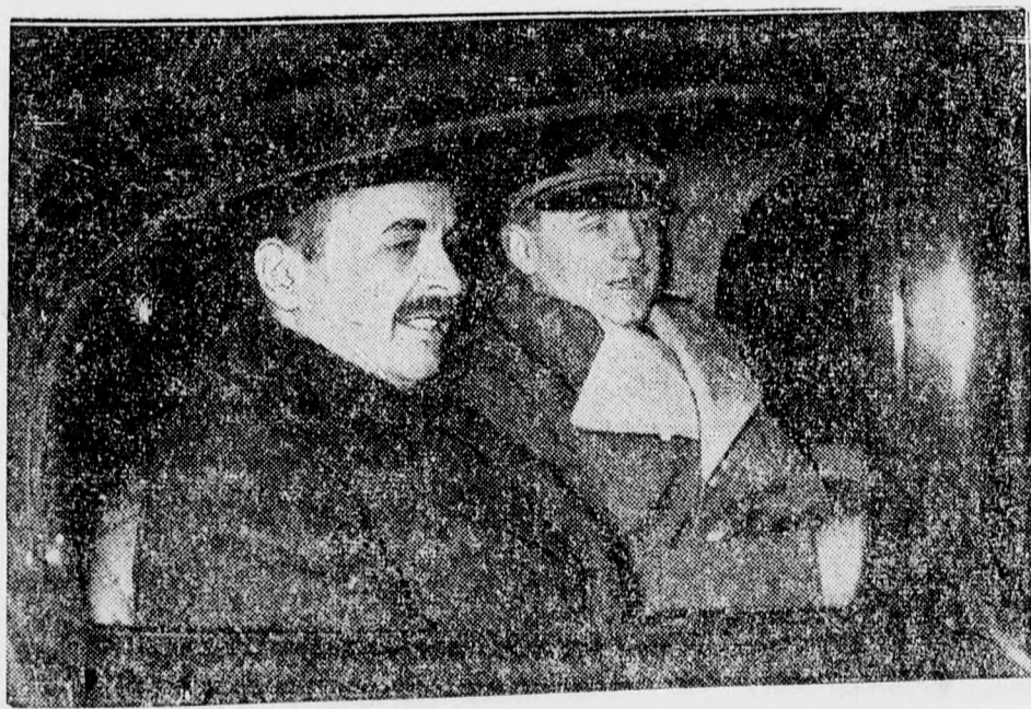
Megírtuk, hogy gróf Csáky magyar külügyminiszter Berlinben folytatott tárgyalásokat. Ez a kép Ribbentrop társaságában ábrázolja.

Nagyvárad. Saját tud. A Kereskedelmi Csarnok felosztása óta sokféle találgatásra adott alkalmat, hogy a Csarnok vagyona kinek a tulajdonába megy át. Beavatott helyről szerzett értesülésünk szerint a minisztertanács foglalkozott a kérdéssel és a Csarnok vagyonának átvételére a Kereskedelmi és Iparkamarát jogosította fel. A miniszteri jegyzéknyv 1-2 napon belül le is érkezik Nagyváradra.