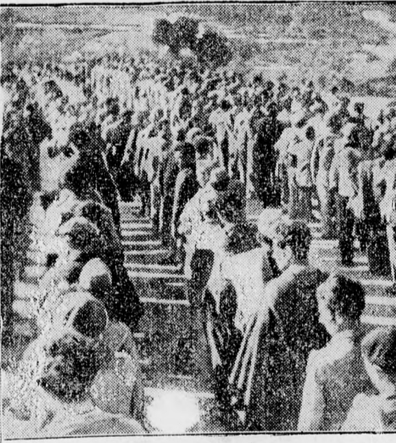
Ezek a spanyol frontról: a baloldali kép a nemzetiek előnyomulásáról készült Katalóniában. Jobbról a fogságba került köztársaságiak csoportja látható.