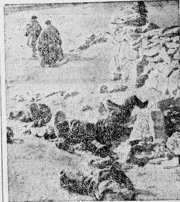
Ez a háború! Megrendítő kép a barcelonai harcokból. Sebesültek és halottak borítják az utat, amely Saragósába vezet

ban is megisméltette beszámolóját. Ott Kánya Kálmán volt külügyminiszter és Teleszky János volt pénzügyminiszter fejezte ki elismerését a beszámoló fölött.