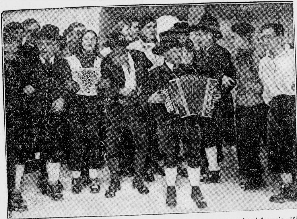
A Salzburg mellett levő Saalfeldenben a napokban nyílt meg egy német-francia ifjusági tábor amelynek 63 francia és 35 német téli-sportot űző lakója van. Ez a kép is azt mutatja, hogy a fiatalok lelkesen pártolják a francia-német barátságot s ebben az öregebbek is