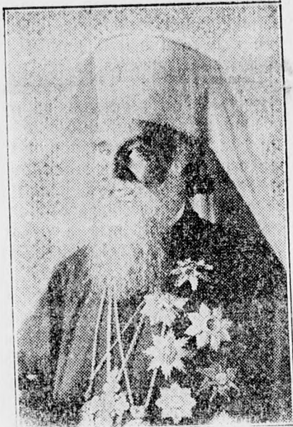
Dr. MIRON CRISTEA patriárcha-miniszterelnök

Bucuresti. Saját tud. A kormány átszervezésére vonatkozó tárgyalások szerdán befejeződtek. Az 1939 február elseji 616. számú királyi rendelettel Öfelsége II. Károly király elfogadta dr. Miron Cristea pátriárcha-miniszterelnök kormá-