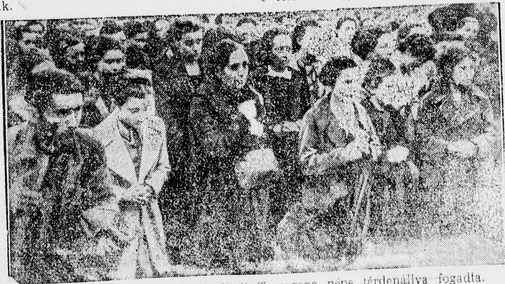
Francó tábornok csapatait a felszabadított Tarragona népe térdendülve fogadta.

Burgosból jelentik: A Rómában időző XIII. Alfonz volt spanyol király üdvözlő táviratot küldött Franco tábornokhoz. A táviratban a nemzeti csapatok győzelmes előhaladását és a nemzeti Spanyolország feltámadását ünnepelte. Hasonló szellemű üdvözlő táviratot küldött Don Juan infáns is, aki már régóta Rómában tartózkodik igen szerény visszavonultságban.