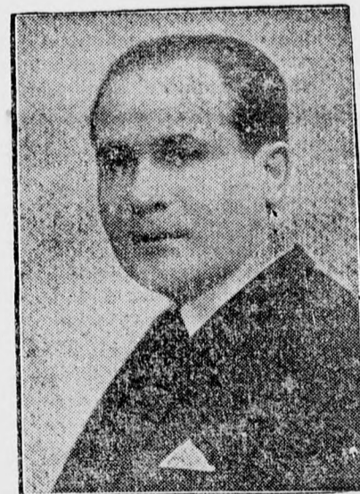
MITATA CONSTANTINESCU pénzügyminiszter

Bucurestiből jelentik: A lapok foglalkoznak a királyi helytartók személyiségével és megállapítják, hogy az új helytartók mind kiváló férfiak, akik vagy a kultúra terjesztése, vagy a tudományos kutatás terén fejtettek ki hathatós működést, vagy pedig kiváló államférfiak. Flondor, tartományi kormányzó régi bukovinai család sarja és ő maga résztvett a nemzetiség mozgalmakban. Tătaru Coriolan, volt államtitkár, egyike Erdély egyik reprezentatív személyiségeinek. Politikus, de szellemi ember is, aki az ifjúság és a sport lelke s támogatója. Giurescu professor tartományi kormányzó pedig Besszarába egyik legismertebb embere.