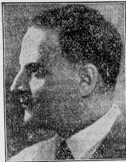
MIHAIL GHELMEGEANU közlekedésügyi és közmunkaügyi miniszter.

Az új kormány tagjai sorában — amint jeleztük — számos erdélyi reprezentáns foglal he-