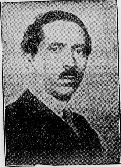
EUGEN TITEANU sajtó- és propagandaügyi alminiszter

2. szakasz. Áthelyezzük Alexianu Gheorghét, a Suceava-tartomány jelenlegi királyi helytartóját a Bucegi-tartományba és Dinu Simiat, a