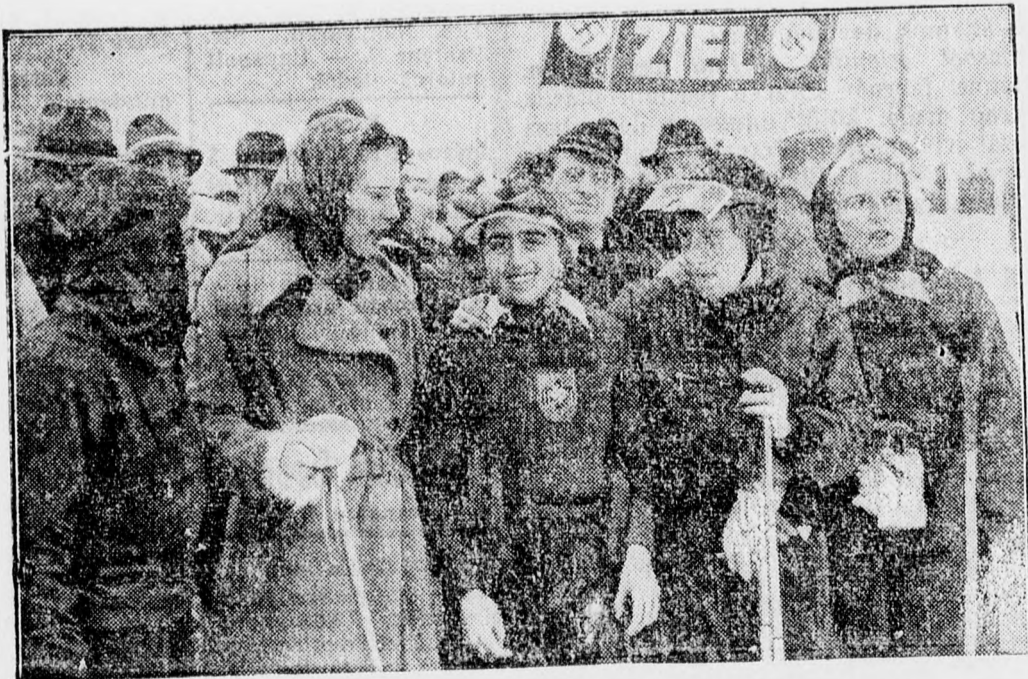
Női versenyzők Garmisch-Partenkirchenben, a híres sí-pályán.

A síelés legfontosabb tartozéka a kintű, jól befűzhető és vízhatlan cipő, ebben az esetben megemlítjük azt is, hogy a cipő nagyon kényelmes legyen, mert különben lefagyhat a láb és a síelés nagyon kellemetlen emléket hagyhat maga után. Eppen azért, aki síelni akar, annak csak azt ajánlhatjuk, hogy alaposan vegye szemügyre a síruhatárát, mielőtt nekivágna a síelésnek, mert a jó felszerelés ennél a sportnál rendkívül fontos.