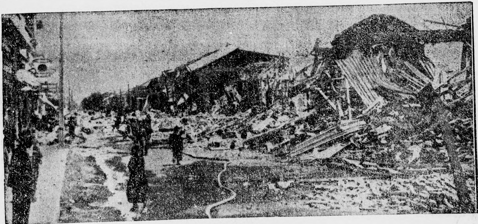
Első kép a chilei katasztrófális földrengés színhelyéről. Ez a kép a rombadólt Chullán városban készült.

zetének tisztázása. 2. A frontharcosok jogi helyzetének kérdése. 3. Az általános közjogi helyzet, amely a zsidó lakosok állampolgári jogának felülvizsgálatát tenné szükségessé. Mindhárom pont elé számtalan akadály torlódik, éppen ezért még mindig módosításra szorulnak. Gróf Károlyi Viktor indítványozta, hogy a törvényjavaslatot bővítsék ki egy szakasszal, amely megtiltja a keresztények és zsidók házasságkötését.