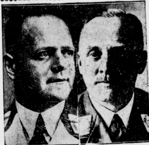
Hitler vezér és kancellár Göring marsall tanácsára változtatásokat vitt végbe a légihaderő vezetésében. Milch (baloldalt) tábornok a légihaderő vezérinspektora lett Stumpf tábornok pedig (jobb oldalt) a repülésügyek főnöke.

— A diákok ötvenöt moldvai, erdélyi, bán-sági és besszarábiai faluban végeztek gazdasági, egészségügyi és közművelődésügyi kutatómunkát, összesen 105.000 falusi lakosról gyűjtve adatokat. Az irni-olvasni tudás tekintetében például Bukovina egyes vidékei nyolcvanöt százalék irni-olvasni tudót mutatnak fel, míg Cetatea-Alba környékén 50 százalékot is elér az analfabéták száma. Besszarábia legtöbb az analfabéta, Erdélyben változók a viszonyok, egymáshoz közel eső területeken is.