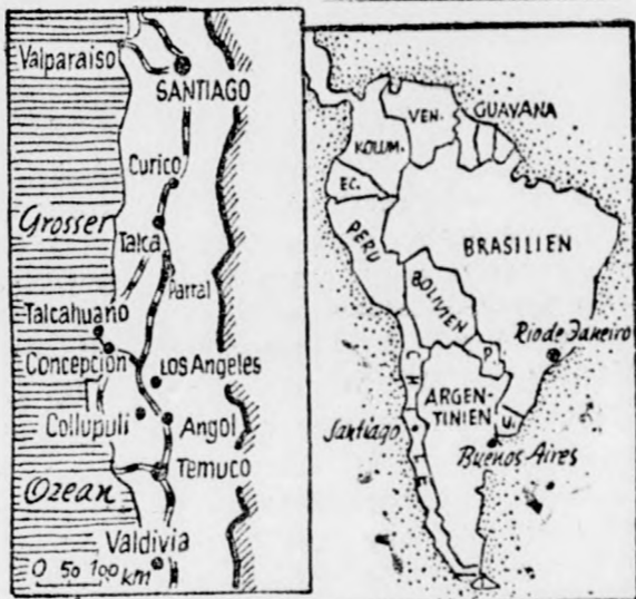
A chilei földrengés helyszínének térképe.