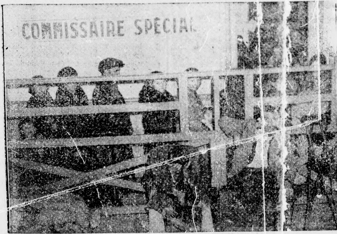
A köztársasági spanyolok tömegével menekülnek Kataloniából Franciaországba. Ez a kép a cserérei határállomáson készült, ahol a menekülők százai várják, hogy átmehessenek a határon