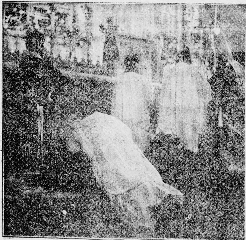
Leborulás az oltár lépcsőin