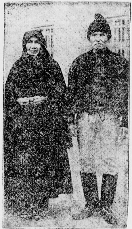
Az öregek az utcán