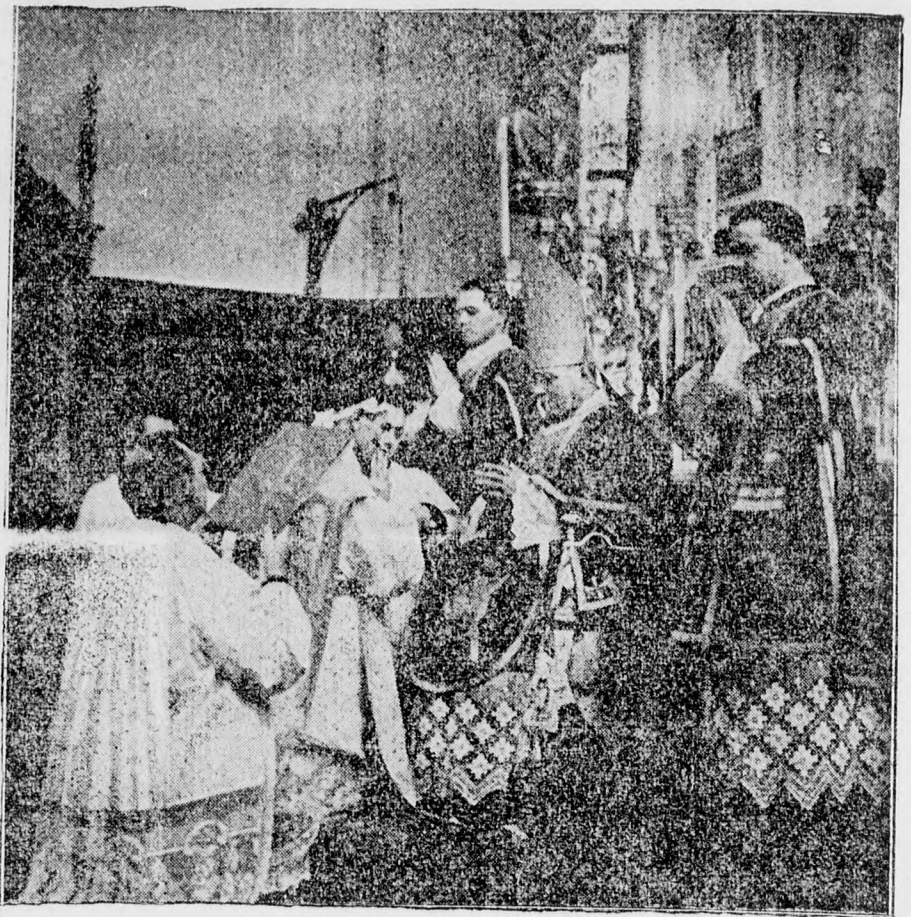
Püspökké fölkenés szentolajjal