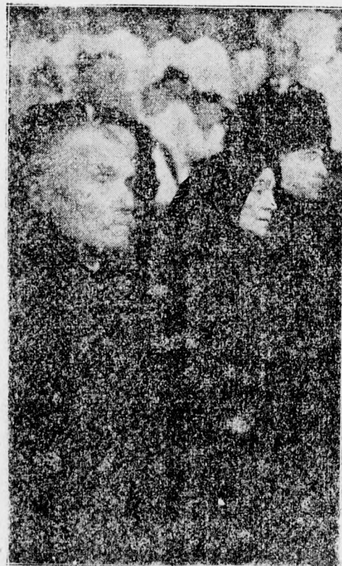
Az öregek nézik fiuk felmagasztalását