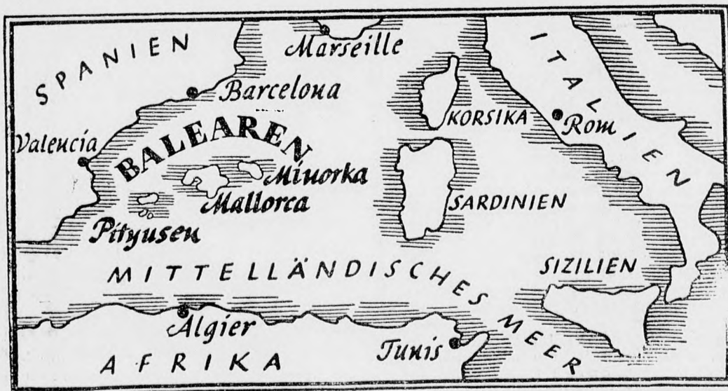
Mussolini tengeri és légitámaszpontot akar létesíteni Mallorca szigetén.

Londonból jelentik: A Havas-iroda közlése szerint angol diplomáciai körökben megcáfolták azt a híresztelést, hogy Chamberlain ajánlatot akar tenni Olaszországnak a Tunisra, Dsibutira a Suez-csatornára vonatkozó követelése tekintetében. Jól értesült körök szerint Róma és London között szóba sem került a kérdés. Perth lord legutóbbi római tárgyalásai során Ciano gróf külügyminiszterrel csak a libiai olasz haderő létszámának kérdéséről tárgyaltak.