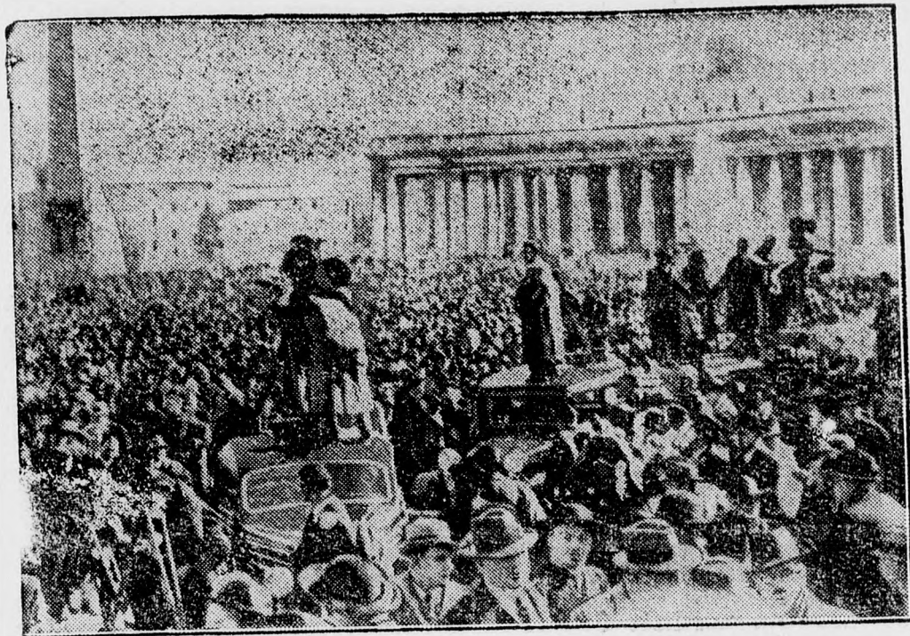
Százezrek várták a Szent Péter-dóm előtti téren a pápaválasztás eredményét

Mese, mese, meskete. Van most belőle bőven. Azt mondják, hogy a Sixtinában mikrofont állítottak be és a bíboros-dékán ezen fogja