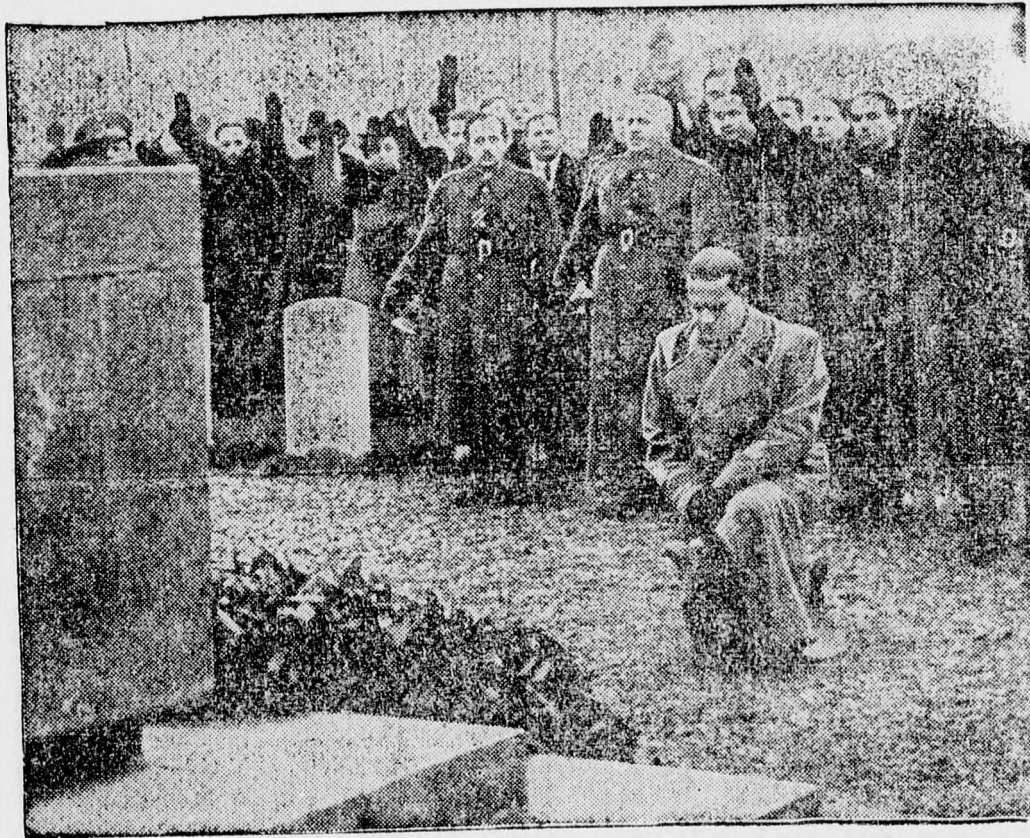
Gróf Ciano Varsóban.

Rómából jelentik: Mussolini március 23-án rádióbeszédet mond Olaszország követeléseiről Franciaországgal szemben. A Daily Mail szerint Mussolini kívánja a Dzsibutiból Addis-Abehába vezető abesszin vasut átadását, szabad kikötőt Dzsibutiban, olasz tagok beválasztását a Suez-csatorna bizottságba és a tuniszi olaszok jogainak biztosítását.