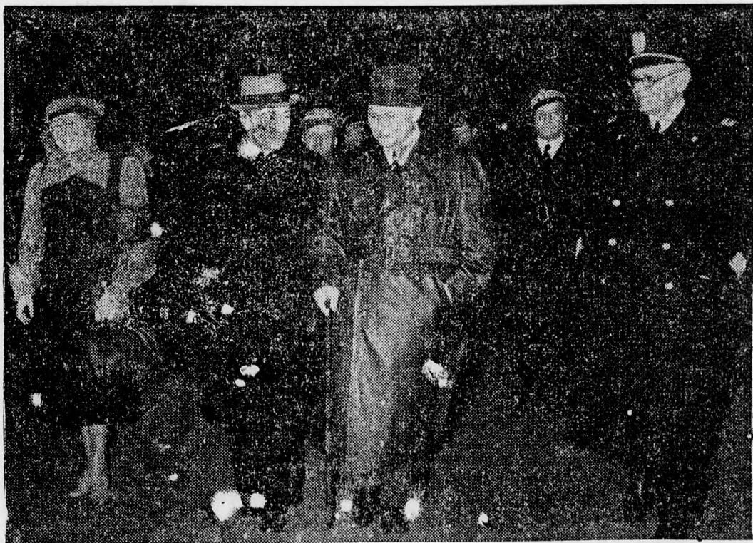
Göring marsall felesége társaságában többheti tartózkodásra Olaszországba utazott. A pályaudvarra Attalico olasz nagykövet (a kép jobboldalán) és gróf Magistrati követéségi tanácsos is kikísérték.

Budapestről jelentik: Basch Ferenc, a magyarországi németek vezére „Az 1938-as társaság” gyűlésén kijelentette, hogy a Sopron-környéki németység hódolatnyilvánító gyűlést és tüntető felvonulást rendez Magyarországhoz érzett hűségének bizonyítására. Basch Ferenc meleg szavakkal emlékezett meg ezután a magyarországi németajku polgárok igaz hazaszeretetéről.