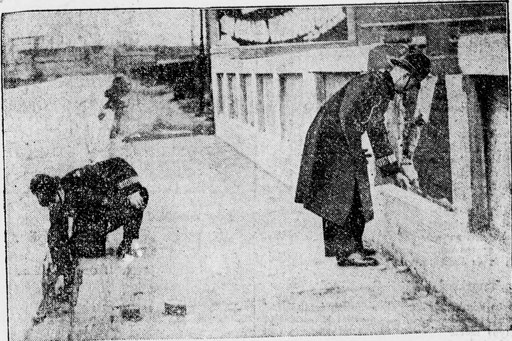
Angliában még mindig robbannak a bombák. Ez a kép London egyik külvárosában történt bombamerénylet színhelyén készült, amikor a vizsgálatot végző rendőrök összeeszedték a bomba maradványait