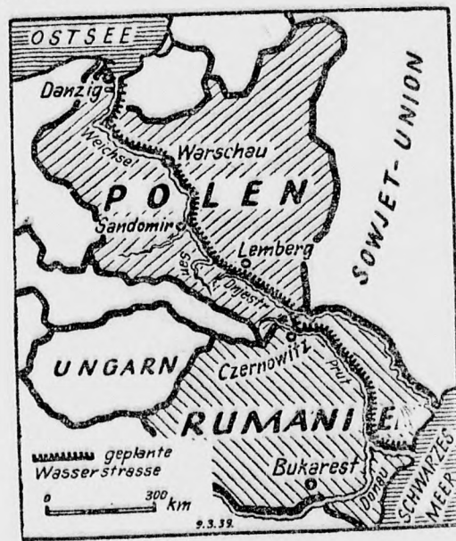
Csatorna az Északi-tenger és a Fekete-tenger között.

Nagyban garázdálkodnak a Pyreneusok medvéi. Párizsból jelentik: A Pyreneusok medvéi ismét rémületben tartják a hegyi falvak lakóit. Az Ossau-völgyben teletelre ostromolt állomásai ellen a medvék csoportosan intéztek támadást s a harmadik órák jühászok közül is többet szétmárcangoltak. A pásztorok elhatározták, hogy nyájakkal a hegység veszélyessé vált lejtőiről a Gironda síkságára felvonulnak téli szállásra. Gabas és Laruns vidékéről szintén barnamedvék garázdálkodásairól érkeznek jelentések. Laruns mellett a medvék egy marhacordát is megtámadtak s néhány borjut elhurcoltak. Az erdőzeti hivatal jelentése szerint az idén a barnamedvék szokatlanul elszaporodtak, az erdőörök a Pyreneusok lejtőin még soha ennyi medvével nem találkozott.