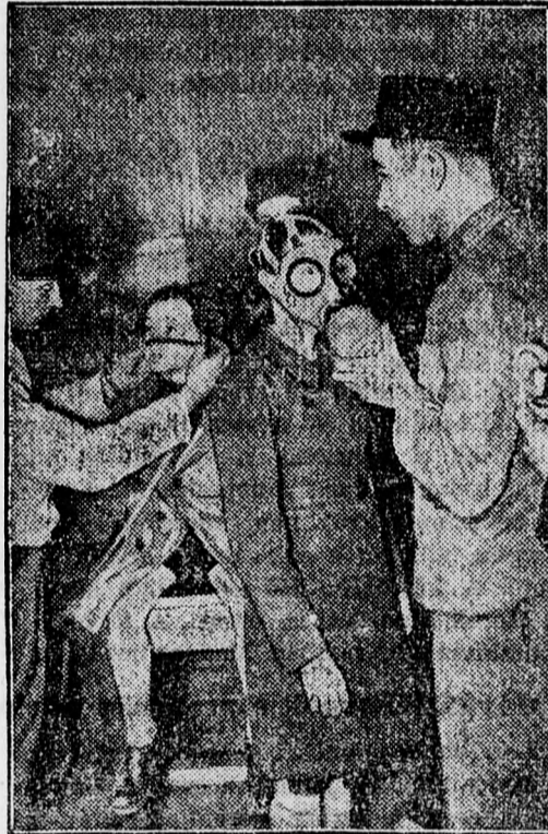
Párizsban kétszázézer gázálarcot osztottak ki az iskolágyermeknek között. Ez a kép a gázálarcok próbájáról készült

APOLLÓ: RÉZTÁBLA A KAPU ALATT. CORSO: OLIMPIASZ.