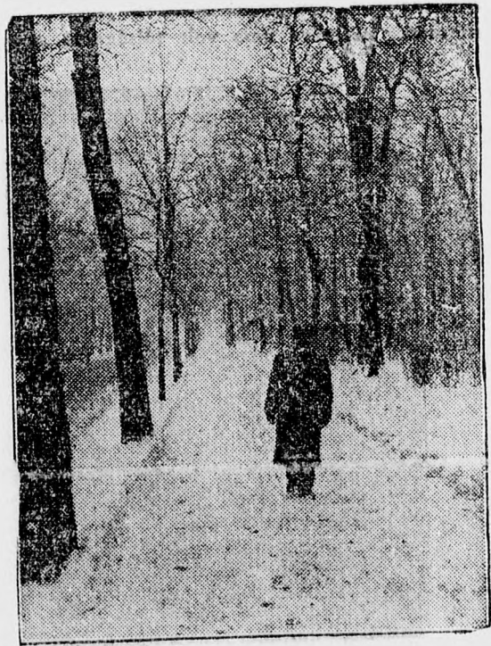
Tél a tavaszban

A kanadai indiánok gyógyfüve gyógyítja a cukorbetegséget. Londonból jelentik: Két angol tudós a kanadai indián kuruzsok által évszázadokon át használt gyógynövényeket tanulmányozva, megállapították, hogy az „ördöggyökér” nevű cserje kérgének nedve épügy gyógyítja a cukorbetegséget, mint az inzulin. Több beteget sikerült a rejtélyes növény nedvével teljesen megszabadítani a cukorbetegségtől és annak következményeitől.