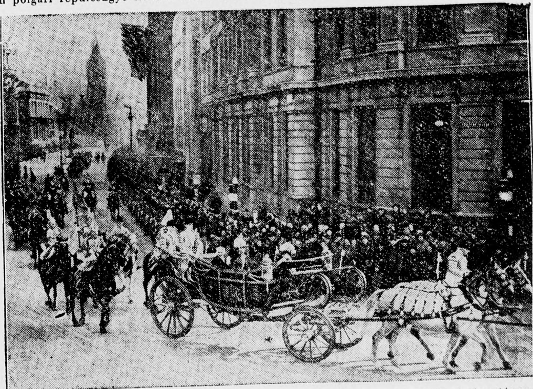
Lebrun, francia köztársasági elnök, aki mint megírtuk, Londonban folytatott fontos tárgyalásokat, ünnepiesen kísérte ki az angol királyt a pályaudvarra. Ez a kép Lebrunt és az angol királyt a hagyományos díszhintóban ábrázolja, amint a pályaudvarra hajtattak

sabb kapcsolat óhaját, minthogy a légi forgalmi szezon küszöbön áll. Megállapodtak a tárgyalófelek, hogy a Lot és Rares az 1940-ben lejárt egyezmény szerint bonyolítják le a forgalmat s az új egyezmény a jövő szezonban lép életbe.