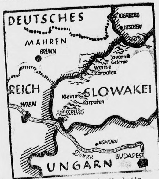
Az új német-szlovák határ

longások voltak: A magyar távirati iroda jelentése szerint március 28-án délután 3 óra 20 perckor László-tanyánál a magyar járőr harmenc főnyi szlovák katonákból és polgári egynekből álló csoport támadta meg. A járőr felvette a harcot, mire a szlovákok visszavonultak. Ugyancsak március 28-án délután negyedhétkor Legenye és Alsómihályi között egy magyar őrjáratra tüzeltek. A magyar katonák a tüzelést viszonzották, a harcban magyar részről senki sem esett el.