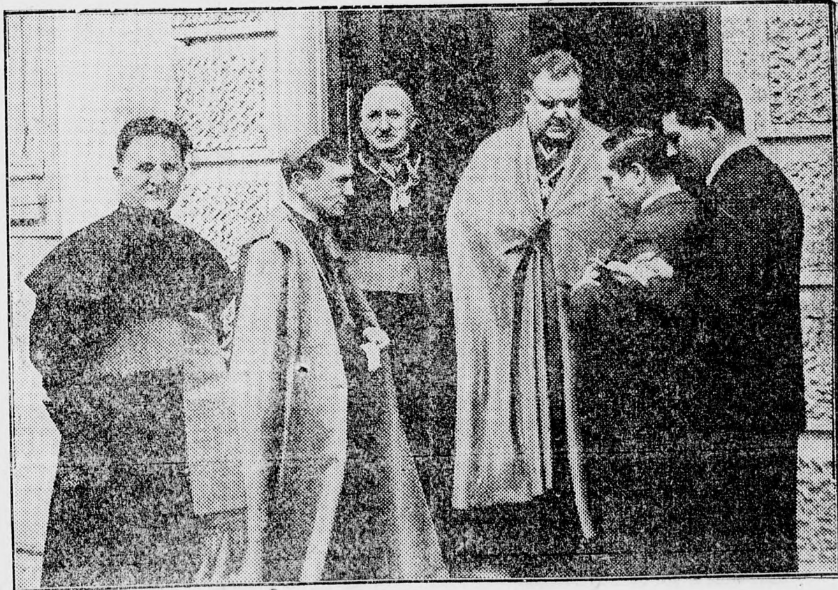
A püspök elbeszélget az újságírókkal

Mire bent a királyi pártfogást kérő ünnepélyes szavak elhangzottak s lila palástos alakja ismét megjelent a palota bejáratában, már közel Erdélyhez keringtek a sugárzó levegőgömbben a ki-kelet drága hírnökei.