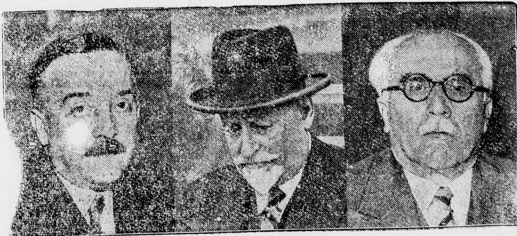
A francia köztársasági elnökjelöltek. Április 3-án lesz az elnökválasztás Franciaországban. Jelölteként emlegetik Lebrun jelenlegi elnökön kívül Henri Queuille földművelésügyi minisztert, C. O. Ferdinand Bouisson volt kamaraelnököt és Justin Godard szenátort.

Egy közel két évtized óta izzó kérdés kapott feleletet akkor, amikor Hitler kancellár ujjongó tömegek sorfala között végig vonult Memel főutcáján. Igen: Memel és nem Klajpeda utcáján. Mert Klajpeda már csak történelmi emlék amint a memeliek mondják: a német mul egyik keserű emléke.