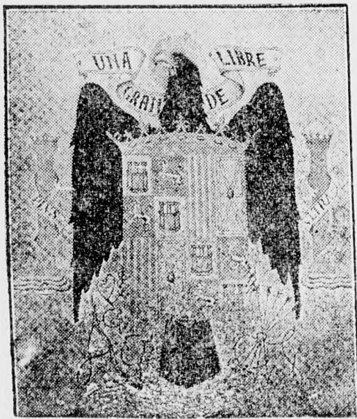
A nemzeti spanyolok címere.

DANIÁNAK 3.777.000 lakosa van. A dán statisztikai hivatal most kiadott jelentése szerint ez a számadat 1938 július 30-ig érvényes. Az elmúlt év ugyanezen időpontjában megállapított 3.749.000-el szemben a szaporulat tehát 28 ezer, amely felülmúlja az előző háromévi 26 ezres, 25 ezres, illetőleg 24 ezres szaporulatot.