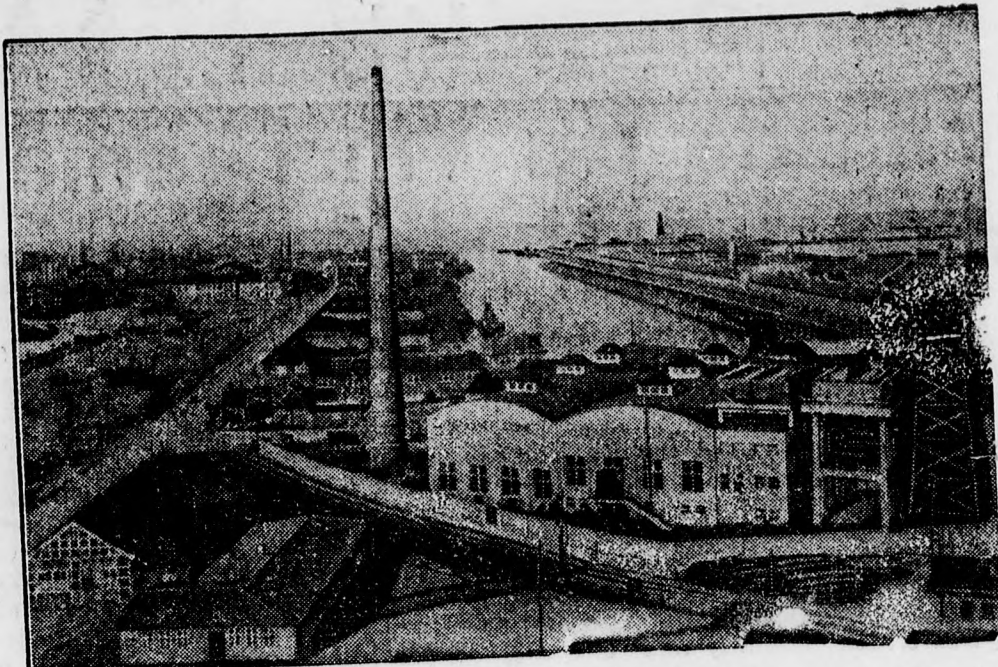
Cuxhavent a németek legnagyobb halászati kikötőjének építették ki. Ez a kép a biztonságos kikötőt s a modern raktárépületeket ábrázolja.

Pozsonyban jelentik: Tiso szlovák miniszterelnök és Durcsánzky külügyminiszter Berlinben Ribbentrop német birodalmi külügyminiszterrel folytatott tárgyalásokat. A tanácskozások Szlovákia gazdasági és pénzügyi kérdéseire vonatkoztak, valamint Szlovákia és a cseh-morva protektorátus közötti gazdasági és pénzügyi viszonyok rendezésére. A „Slovak” jelentése szerint a fennálló kérdések mindkét fél melegegésére tisztázódtak. Tiso és Durcsánzky csütörtökön visszaérkezett Pozsonyba.