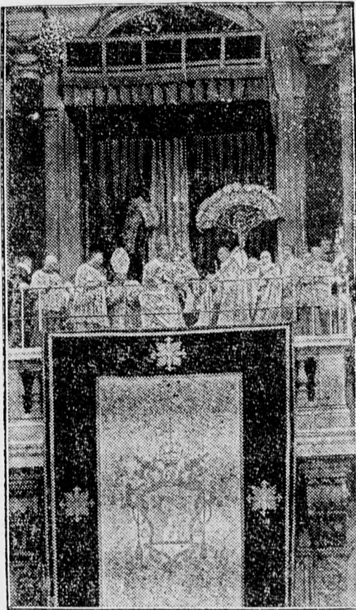
XII. PIUS PAPA, húsvét első napján áldást osztott a Szent Péter-dóm erkélyéről

Az Aventin déli oldalán, egy mohos, ókori omladékkal tetején tűzpiros pipacs köszönti rám