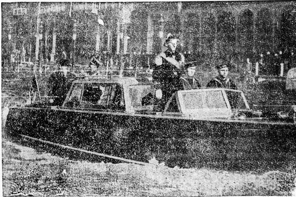
Markovits jugoszláv külügyminiszter a velencei megbeszélések után Ciano gróffal sétahajózáson indult a lagunákon

Berlinből jelentik: Az Essener National Zeitung jelentése szerint a csehországi Pilsenben durva németellenes tüntetések folytak le. Ismeretlen tettesek az utcákon, a villamosokon sósavval öntöttek le a német katonákat. A német katonai parancsnokság az okozott károkért Pilsen városát tette felelőssé. Száz pilseni lakost és a cseh nacionalista párt 50 tagját őrizetbevettek.