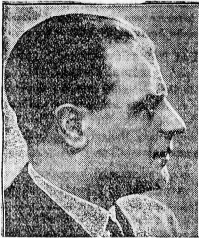
GRIGORE GAFENCU külügyminiszter

A háború elején — folytatja cikkét a Paris Soir — Gafencu katonai pilóta lett és pompás teljesítményeivel magas angol, francia és román kiüntetésekert nyert el. A háború után, 1919-ben, a levegő hőse sajtó szolgálatba lépett. Távirati ügy-