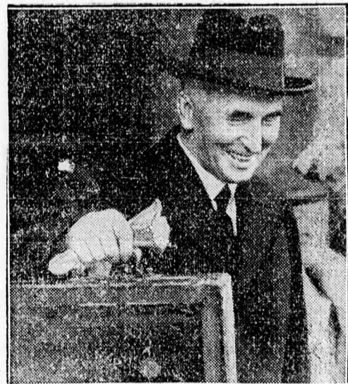
Sir John Simon angol kincstárnok betérjesztette az új költségvetést, melyben jelentékeny adóemlések vannak. Ez a kép Sir John Simont a nevezetes ülés után ábrázolja.

A Tribuna visszautasítja a francia sajtó hangjából kicsendülő kívánságot, hogy Olaszország közvetlenül Lengyelország és Németország között. A francia lapok Olaszország helyzetét európai háború esetén kétségbeesettnek ígyekeznek feltüntetni és úgy állítják be, hogy Olaszországnak érdeke a háborút elkerülni. A francia sajtó azonban ezúttal is ábrándokban ringatja magát, — fejezi be a Tribuna .