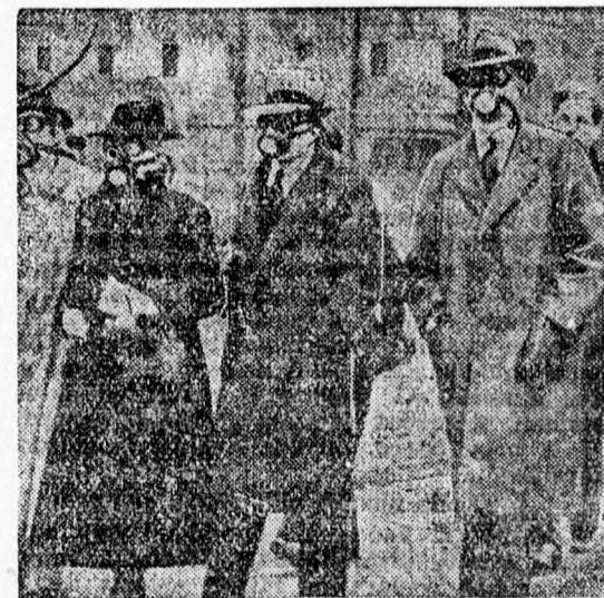
Az amerikai olajipari munkások sztrájkolnak. A sztrájkolók ellen a rendőrség könnyfakasztó gázbombákkal vonultak fel, mire a sztrájkolók kisebb gázálarokokat vettek fel és így vonultak fel. Jelmező ez az amerikai viszonyokra.