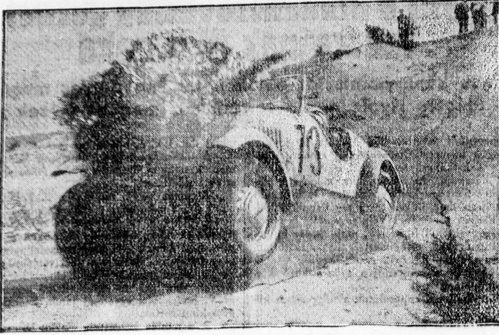
Keletporoszországban most folynak nehéz terepen a gépkocsiversenyek. A mazuri vidéken a rendkívül homokos, köves talajon egy gépkocsi egyenesen a hátsó kerekeire állt, miközben óriási porfelhő vette körül, — mint az képünkön is látható.