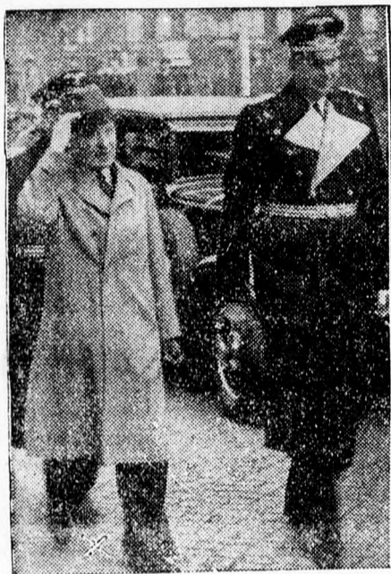
Urbsys litván külügyminiszter (X) Berlinbe érkezett, a litván-német gazdasági egyezmény aláírására. Ez a kép érkezésekor készült.

Buenos Airesből jelentik: A Világ Postaegyesület kongresszusán zavarok támadtak. Jóllehet a volt cseh kiküldött a közép-európai politikai újrendezés következtében már a kongresszus kezdete előtt elutazott, az Egyesült Államok és Franciaország kiküldöttjei — Argentina kiküldöttének közbelépése ellenére — ragaszkodtak ahhoz, hogy Csehországot fölvegyék a zárójegyzőkönyvbe. A német, olasz, magyar és spanyol megbízottak erre nem írták alá a jegyzőkönyvet.