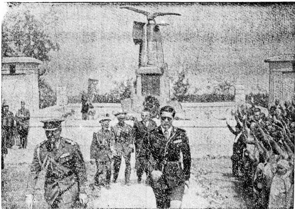
A Prunari melletti ütközet emléknapján Mihály nagyvajda is megjelent az ottani csatatéren és koszorút helyezett el a hősök sírján.