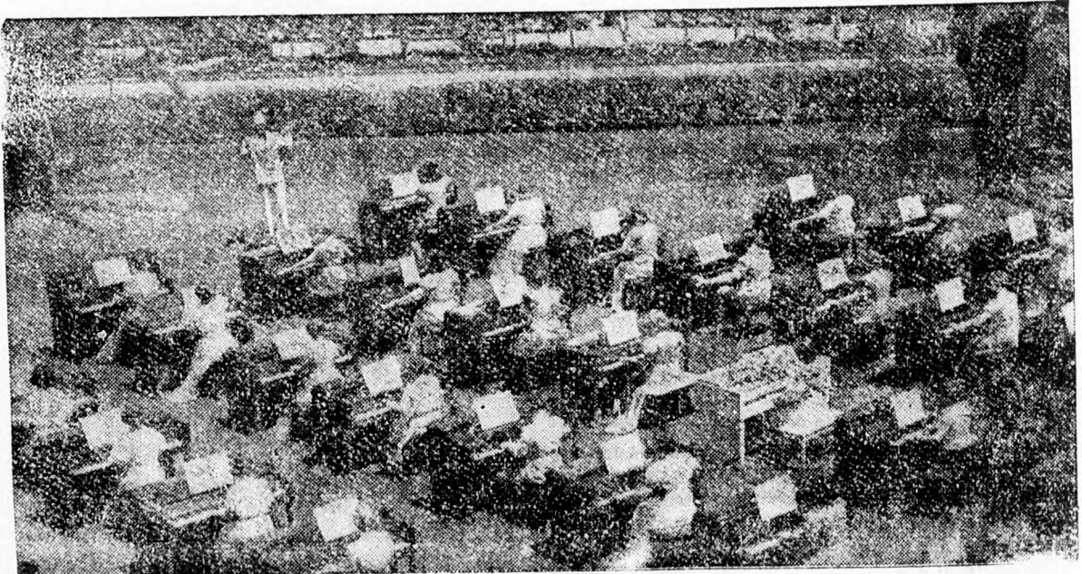
A kaliforniai Long Beachban a nemzeti zene-hetét óriási zongorahangversenyvel nyitották meg, amelyen 40 zongorán játszottak.

A mai keresztény könyvnyomdák gépei, remegve, dübörgőve dolgozó körforgó gépióriási szeretettel és hálával tekintenek majdnem háromszázéves ősük felé ott a kolozsvári ferencesek múzeumban... A nagy időket átélte egyszerű kézisajtó pedig büszke szülői örömmel tekint utódaira... Tudja azt, hogy a keresztény magyar könyvnyomtatás ügye Erdélyben is, teljesen modern eszközökkel, gépcsodáival nyugati színvonalon áll.