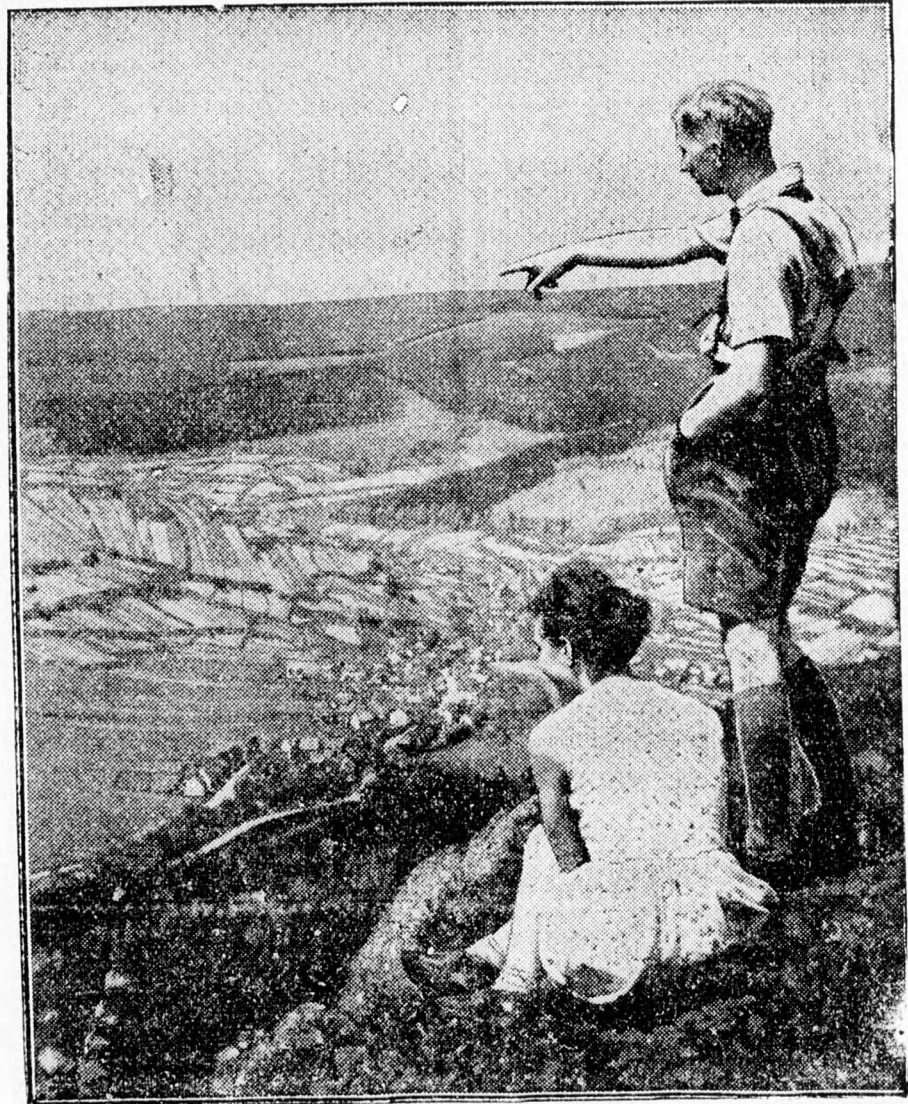
Erdélyi hegyek közt...

Párizsból jelenik: Guglielmo Ferrero, a Franciaországban élő világhírű olasz történetíró legújabb munkája, amely „Bonaparte Olaszországban“ címmel most hagyta el a sajtót, nagy feltűnést keltett s egyben felzúdulást idézett elő a francia történészek soraiban. Ferrero könyve új beállításban ismerteti Napoleon 1796—97-es északolaszországi diadalmas hadjáratát s megnyitja a nagy hadvezér dicsőségét. Ferrero szembe helyezkedik azzal az eddigéig általánosan elfogadott felfogással, amely szerint az északolaszországi hadjárat ragyogó sikerei s az azt követő békekötés eredményei Bonaparte katonai és politikai lángelméjének tudható be. Ferrero mindenekelőtt kimutatja, hogy 1797-ben, amikor Ausztria jegyverszmenetért, voltaképpen egyik fél sem volt győző, vagy legyőzött. Bonaparte a valóságban csak néhány jelentéktelen győzelmet aratott, de a dicsőség ezért sem őt magát illeti. A hadjárat egész tervét a legkisebb részletekig a párizsi direktórium dolgozta ki s Bonaparte mindenben szigorúan követte ezt a haditervet. Egyéni kezdeményezésről a katonai lángelme megvillandásairól szó sem volt s az északolaszországi hadjárat igazi győztesei Barras és társai voltak. A francia történetírók „elképesztőnek“ minősítik Ferrero állításait. Louis Madelin, az akadémia halhatatlanja, szemérem veti Ferreronak, hogy felkészültség nélkül írta meg munkáját, nem hatolt be kellőképpen a korba s könyve egy nagy történetíró sajnálatos eltévelyedése.