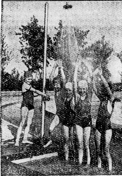
Itt a nyár!

szük és megkenjük a következő túrókrémmel: negyed kiló túrot áttörünk, hozzáadunk három tojás-sárgáját, kis vajat, jócskán vagdalt zöld kaprot, kevés sót, tejfelt és vaniliás cukrot. Végül a három tojás habját is hozzákeverjük. Az egészet jó vastagon rákenjük a tésztára, a megmaradt tésztamenyiségből pedig rácsot fonunk rá, tojással megkenjük és sütjük.