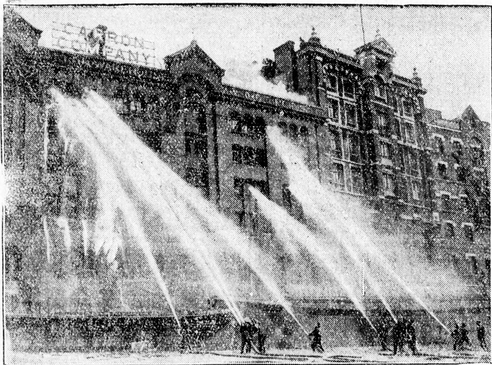
Londonban hatalmas tüzvész pusztított a az alsó Themésnél leégett egy óriási áruaktár. Képünk az oltási munkálatokról készült

A japán követ felhívta a moszkvai kormány figyelmét arra a tényre, hogy ebből a helyzetből igen súlyos konfliktus állhat elő.