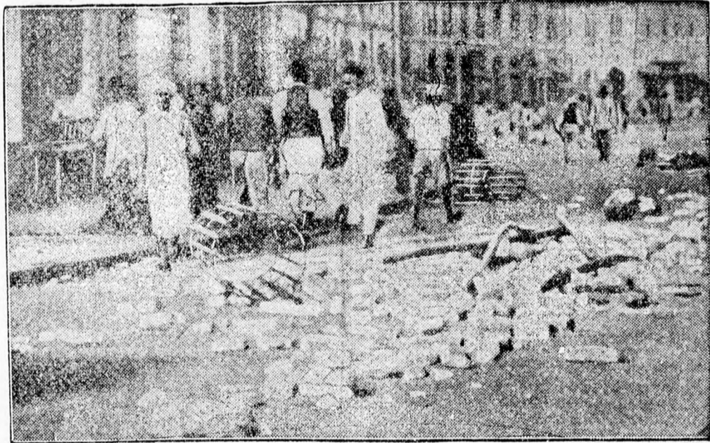
Indiából nyugtalanságokról érkeznek hírek. Ez a kép Bombay egyik főútján készült, ahol egy hindu tüntető tömeget az angol rendőrség megtámadott és szétszórta. Képünk az összecsapás nyomán megrongált kövezetet és kidőlt villanypóznákat mutatja.

A marosvásárhelyi római katolikus tanítóképző igazgatósága pályázatot hirdet az 1939-40-ik iskolai évre 6 ingyenes helyre. Pályázhatnak a gimnázium IV. osztályát jó eredménnyel végzett azon növendékek, akik a szükséges korhatárt át nem lépték, testileg jól fejlettek, egészségesek és zenei hallásuk fejlett. Előnyben részesülnek a földműves családból származó fiúk. Kéréseiket legkésőbb 1939. augusztus hó 25-ig okmányokkal felszerelve küldjék a tanítóképző igazgatósága címére (Scoală Normală rom. cat. de băieți. Târgu-Mures). Választ kéréseikre csak a felvételi vizsgák letétele után kapnak.)