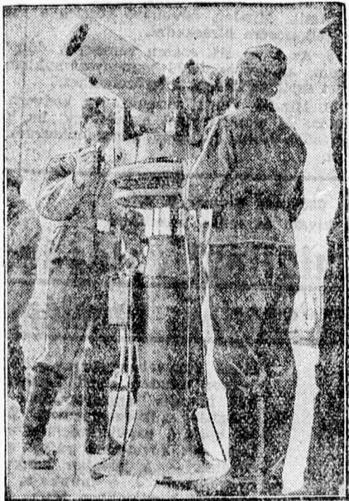
Érdekes felvétel a német keleti határon tartott léghárítói gyakorlatról, amelyen a legújabb optikai műszereket próbálták ki.