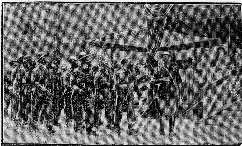
Nagyszabású légvédelmi gyakorlatot tartottak Nápolyban, a teljes katonai és polgári véderő igénybevételével. A gyakorlat befejezése után a csapatok elvonultak a Nápolyban időző piemonti herceg előtt.

gánjellegű fizetést akarnak a külföldön teljesíteni, kérvényeikkel a jövőben is a nemzetgazdasági minisztérium mellett működő valutaügyi bizottsághoz kell fordulniok. Ha folyamodványukat a bizottság elfogadja, a szükséges valutát, vagy devizát nem a Nemzeti Bank szolgáltatja ki hivatalos árfolyamon, hanem az érdekeltek a minisztériumtól kapott engedély alapján a megengedett mennyiségű valutát szabad forgalomban, egy devizakereskedelmre feljogosított magánbank útján szerezhetik be.