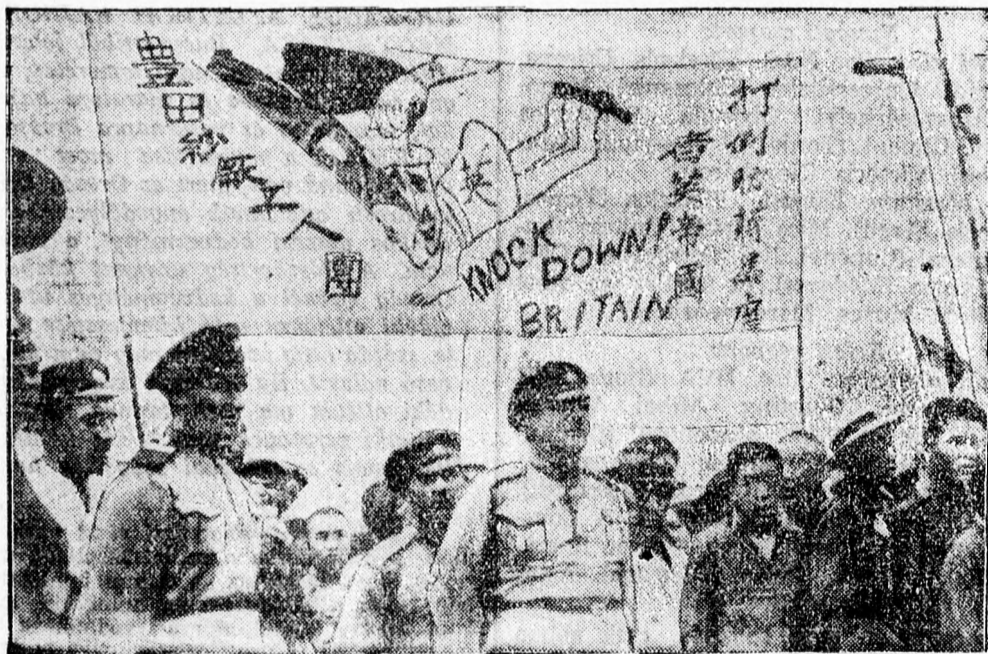
A Tsingtauban élő fehér-orosz textilmunkások nagy tüntető felvonulást rendeztek az angolok ellen. Ez a kép az ottani demonstrációról készült.