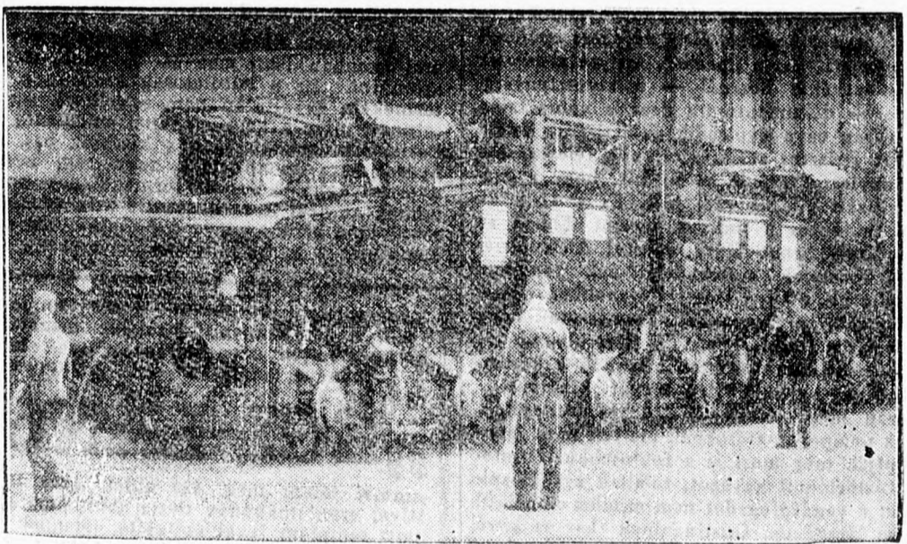
A világ legnagyobb tehermozdonya készült el Kesselben. Az új mozdony 19 m. hosszú, 3000 mázsa összsúlya van és 30 ezer mázsanyi teher vontatására képes

Budapestről jelentik: Az amerikai magyarság Verhovai segítő egyesületének egy csoportja és az Amerikában élő magyarok második generációjából számosan vasárnap Budapestre érkeztek. Az amerikai magyarok a Pilsudszky-névű lengyel hajón tették meg az utat Gdyniáig és onnan Lembergben keresztül utaztak Budapestre. Az érkezők első ünnepélyes fogadtatása Munkácson volt, majd hasonlóképpen meleg és lelkes fogadtatásban részesültek Budapesten is.