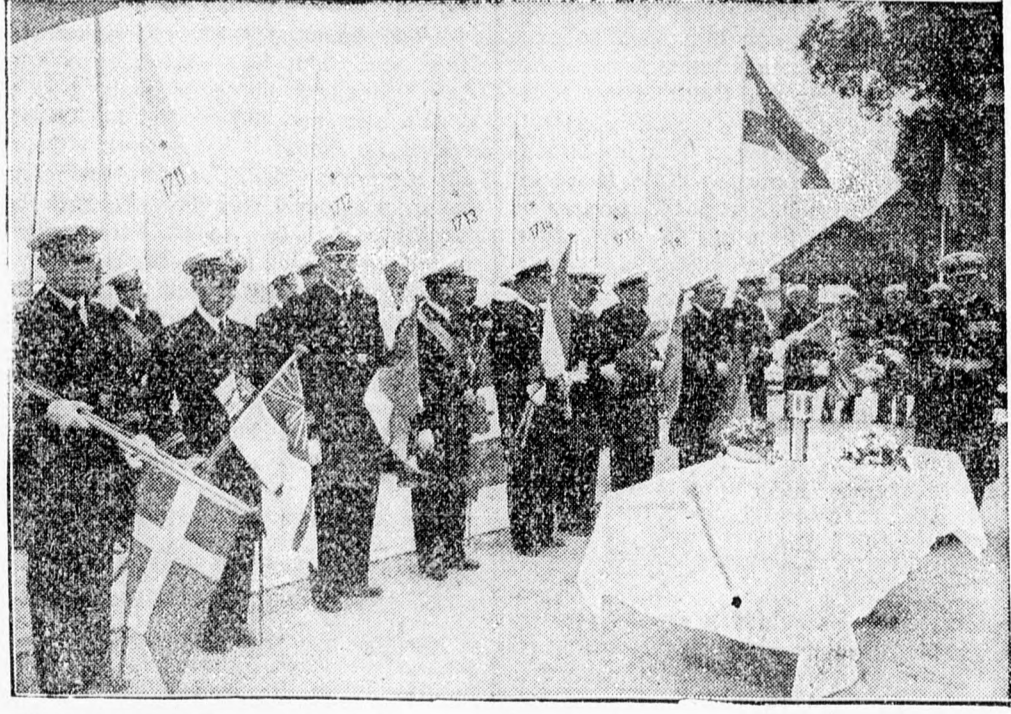
Most folyik Kielben a partok mentén a nemzetk virolásverseny, amelyen kilenc nemzet tengerészcsapatai küzdenek a Hitler által alapított Hindenburg kupáért. Képünkön a verseny résztvevői láthatók