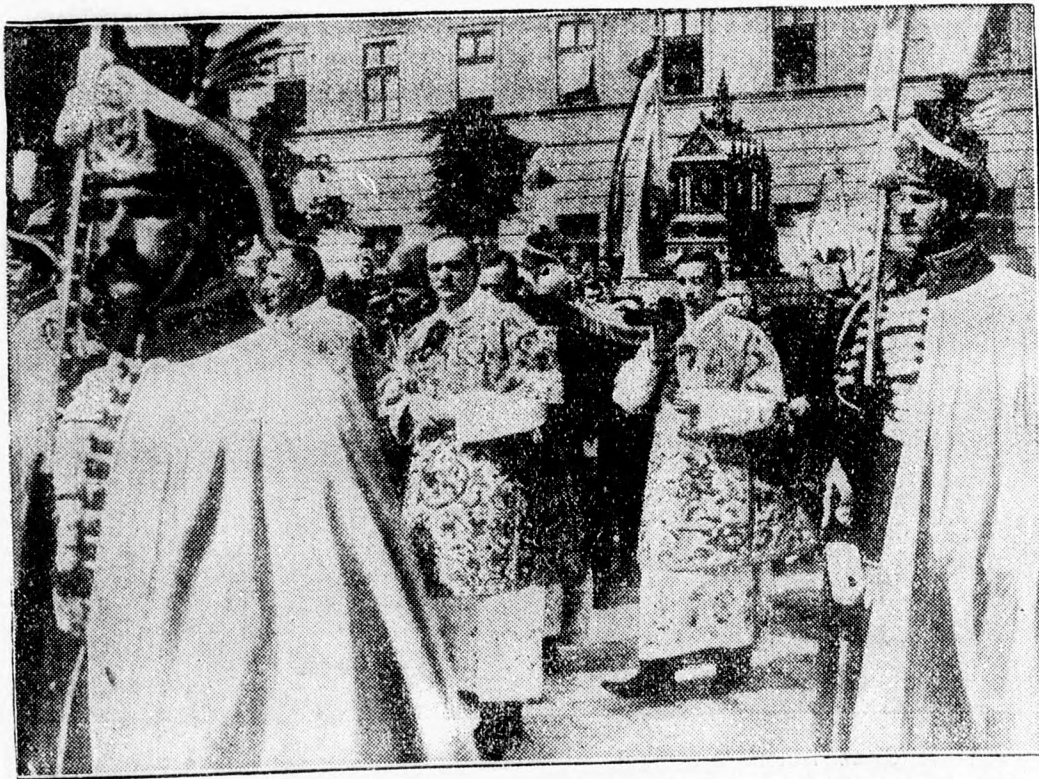
Ma üli meg Magyarország első szent királyának, Szent Istvánnak az ünnepét. Ezen a napon tartják meg fényes keretek között a hagyományos körmenetet, amelyen a szent király épségben maradt jobbát hordozzák körül. Képünk az ünnepélyes körmenet egy részletét mutatja a Szentjélel.

A lapok szerint nyomban azután, hogy az angol-lengyel szerződést aláírják, sor kerülhet a hármas segélynyújtási egyezmény aláírására. Rüsdli Aras londoni török nagykövet az angol külügyminiszter legutóbbi londoni tartózkodása során ismételt megjelent a külügyi hivatalban és már megbeszélte a szerződés szövegét.