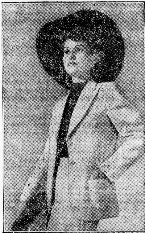
Fenti képünkön nagyon csinos nyárvégi öltözék látható. Ez az angolos szabású kosztüm homokszínű, könnyű gyapjuszövetből készül, rozsdavörös selyemből, ugyanilyen színű, nagykarimájú kalappal és kiegészítéssel.

Azoknak, akik még nem utaztak el a tenger mellé, falura — és akik még ki akarják egészíteni ruhatarukat egy kellemes, olcsó és hordható ruhával, jó tanáccsal szolgálhatok: csináltassanak nagymintás csinszából egy elől végiggombolt, csipőtől bőségesen húzott, bubigalléros, puffos ujjú ruhát. Ha a csinsz sötét alapon fehérmintás, akkor a négyzetes vagy szívalakú kivágást és a rövid ujj szélet egycentis fehér csipkefodorral szegélyezzük.