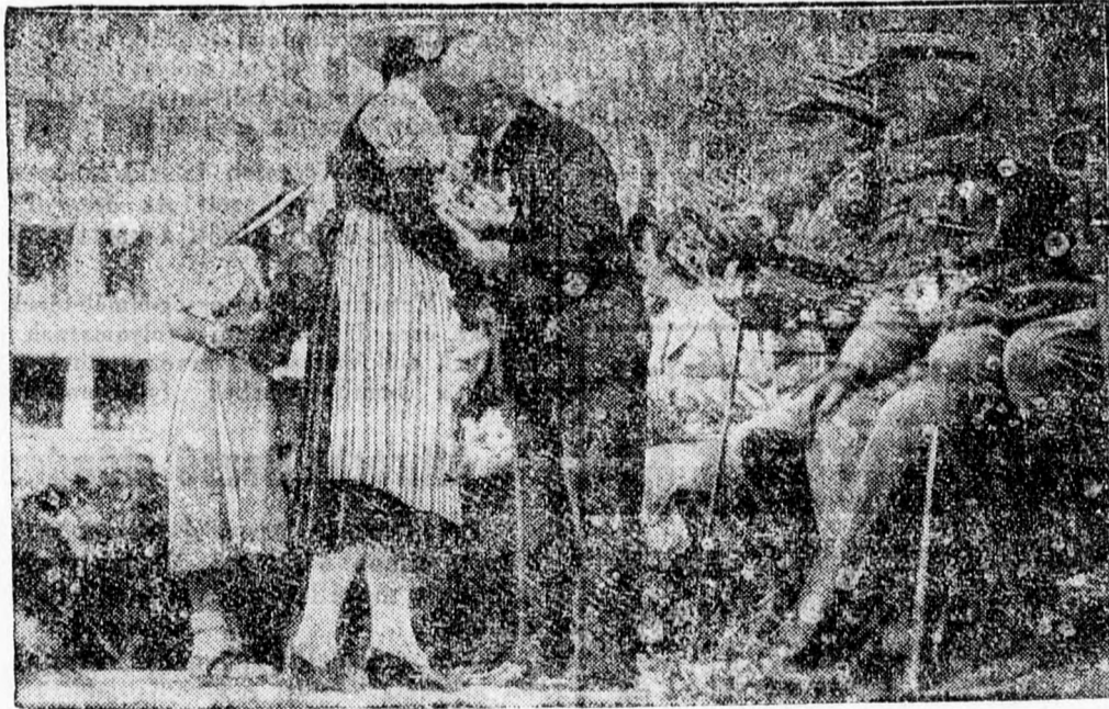
A svájci népviseletek ünnepét tartották meg Zürichben előkelő közönség előtt. Ez a kép akkor készült, amikor Giuseppe Motta szövetségi kancellár apai csókkal üdvözölte a waadföldi résztvevőt.