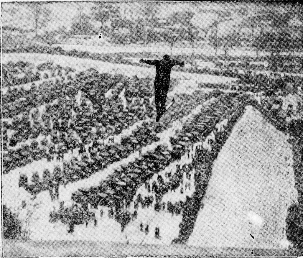
Svájcban már élénk téli sportélet folyik. Ez a kép egy gyönyörű síugrásról készült.