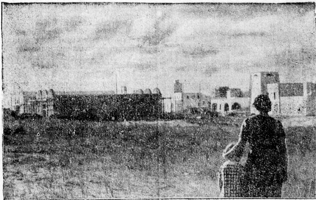
Libiában erőteljesen folyik az olasz telepítés. Ez a kép új telepés házakról készült.

elnöke és Constantin Argetoianu királyi tanácsos a szenátus elnöke is. A minisztertanácson megtárgyalták azokat a törvényjavaslatokat, amelyeket a kormány a törvényhozó testület mai ülésére terjeszt. A képviselőház ülése délután fél 4 órakor, a szenátus ülése pedig 5 órakor kezdődött meg.