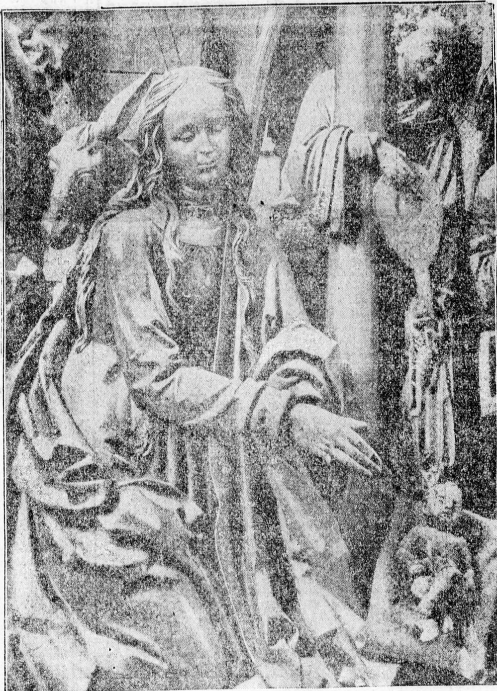
Veit Stoss gyönyörű domborműve (1523-ból.) A bambergi székesegyházban őrzik

Mindenki más pedig, aki tettel nem teheti, legalább szóval és írás-