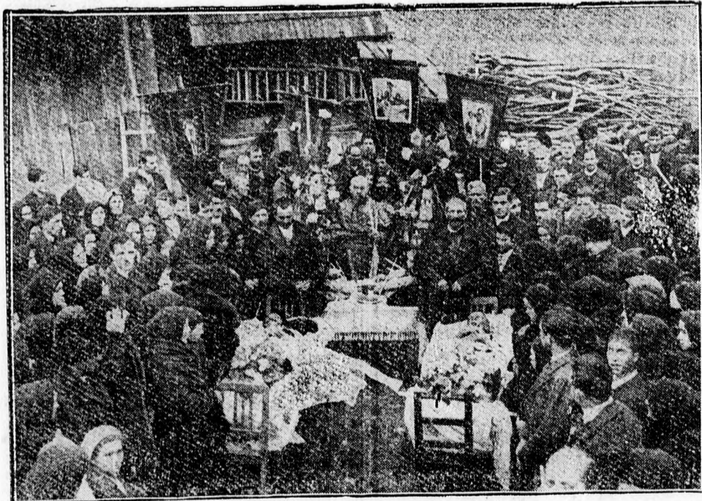
A zernesti katasztrófa áldozatainak temetéséről most kaptuk meg az első képet. A hevenyészett ravatalok körül az áldozatok hozzátartozóinak tömege áll.

Tekintettel az idő rövidségére, hogy a januári évnegyed érvényesítése minden akadály nélkül történhessen, a vezérigazgatóság engedélyt adott a láttamozó szerveknek, hogy az első évnegyedet a vasuti kedvezményes igazolvány második oldalán lévő üres oldaltészen igazolhassák a következő szöveggel: „Viza pentru trimestrul Ianuarie 1940”. A pótlapokat az illetékes minisztérium után a hatóságok fogják beszerezni.