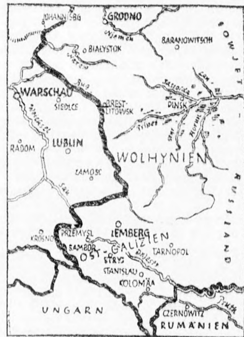
Az orosz szovjet által elfoglalt lengyel területnek az a része, ahonnan mintegy százhuszezer német telepes költözött vissza Németországba.