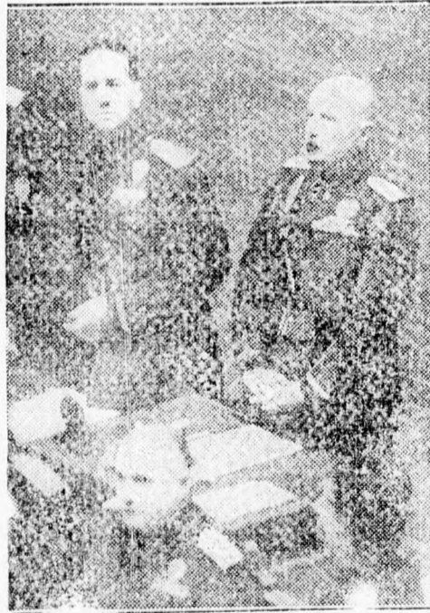
Ciano gróf, olasz külügyminiszter ismeretes külpolitikai beszédét tartja az olasz kamarában. Mellette a Duce látható.