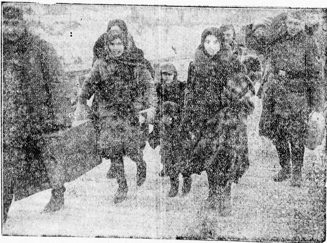
A napokban érkeztek meg Németországba Orosz-Lengyelországból az első német visszatelepülők. Ez a kép a Bug új hídján készült. Hrubieszownál az érdekes ranszportról.

— Sokan kérdeik. — fejezte be Aurel Pavel dr. — lehet-e olcsóbbodást várni? A kérdésre klasszikus választ adhatunk: Olcsóbbodást csak a bőség hozhat. A maximumra kell fokozni a mezőgazdasági és ipari termelési hozamot és meg kell gyorsítani a belföldi termékek országos szétosztását.