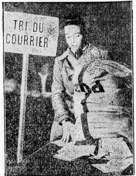
A Nemzetközi Vörös Kereszt genfi központja ismét átvette a hadifoglyok levelezésének a közvetítését és a súlyos sebesültek kicserélésének az intézését. Ez a kép egy svájci cserkész ábrázol a postaosztályon, amin egy postászkot vesz át

Pénteken délután a társulat már vissza is utazott Kolozsvárra.