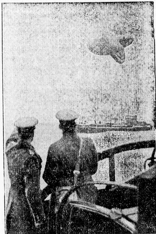
Anglia keleti partjain új aknaövet raktak le, nagyon kevés átjáróval. Ezenkívül a léggömbzárlatot is megszorították, a német repülőgépek távoztartására

Oslóból jelentik: A norvég király csütörtök este a királyi kastélyban ebédet adott a képviselők tiszteletére. A király beszédében utalt a jelenlegi háborúra és kijelentette, hogy a finn-szovjet viszály újabb veszedelmet jelent. Reméli, úgymond, hogy hamarosan létrejön a béke. Norvégia eddig nem keveredett bele a háborúba, de azért sok nehézséggel kell megküzdenie. Meggyőződése, hogy a nép testvéri együttérzése útján biztosíthatják a szabad és független Norvégiát.