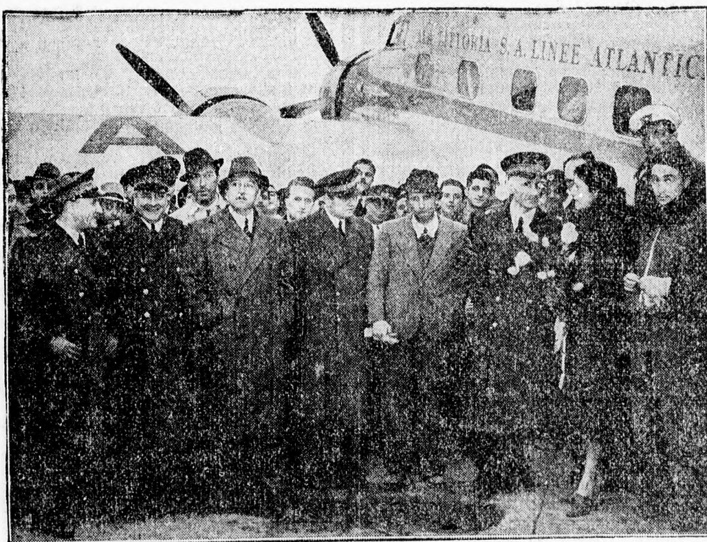
Mint ismeretes, Olaszország és Brazília között megindult a rendszeres légijárat. Ezen a képen az első braziliai utasszállító olasz gép látható, a római repülőtéren, a tisztikarral és az utasokkal.

DORIAN: A VÉN LEANY. APOLLÓ: AZ ELSŐ CSÓK. CORSO: AZ OREGONI GYLKOS.