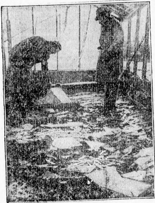
Endfieldben, London külvárosának egyik gyárában robbanás következtében tűz tört ki, több ember meghalt. A robbanás a környéken is sok pusztítást vitt véghez. Ez a kép a robbanás színhelyén készült.

Az Argus indexei szerint is a ruházati cikkek és élelmiszerek drágulásai meghaladják az átlagdrágulást.