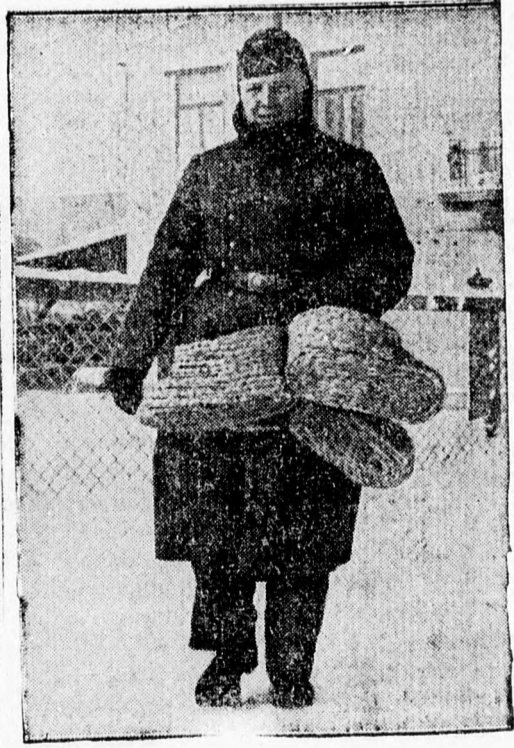
Téli képek a németek által megszállott Lengyelországból: a nagy hideg ellen prémbundával és szalmacipővel védekeznek a német katonák.