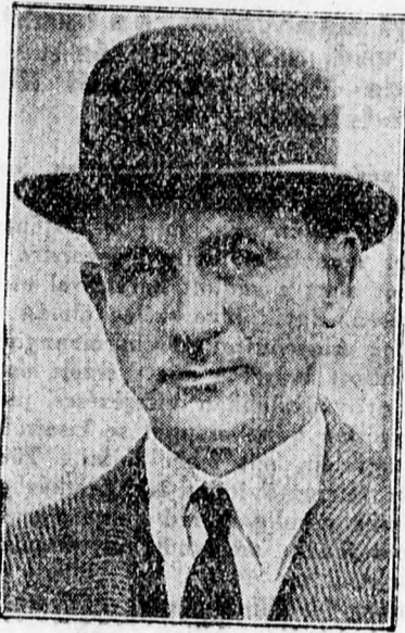
Welles, északamerikai külügyi államtitkár, Roosevelt személyi megbízottja, szombaton indult el európai körútra, melyet az egész világ nagy érdeklődéssel figyel.

Adományok. Sz. D. 30 lejt és egy élelmiszere comagot küldött Szakáll István és családja részére. Rendelkezési helyére juttatjuk.