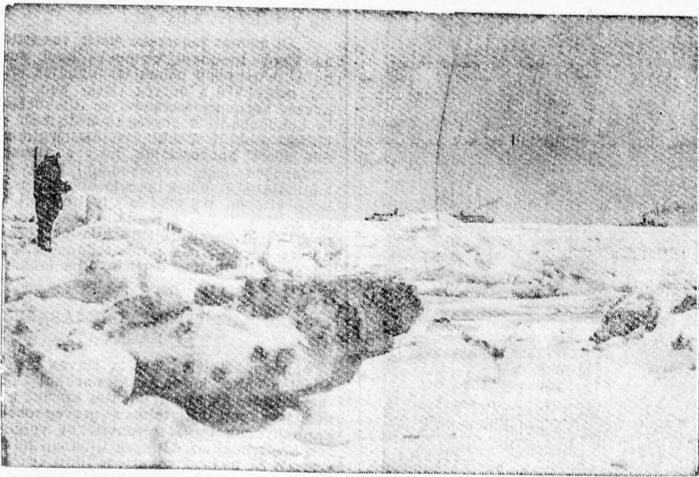
Az erős tél rendkívül megnehezítette a dán hajózást is, főleg Dánia és Svédország és az egyes dán szigetek között. Például Seeland és Fünen szigetek között a komp rendszer viszonyok között 1 óra alatt teszi meg az utat, míg most az 14 óráig tart. Ezen a képen a komp vontató jégtörő hajó látható, a nagy Belt öbölben

Párizsból jelentik: A hivatalos francia hadijelentés szerint a németek a Moseltől keletre sikertelen rohamot intéztek a francia előőrsök ellen.