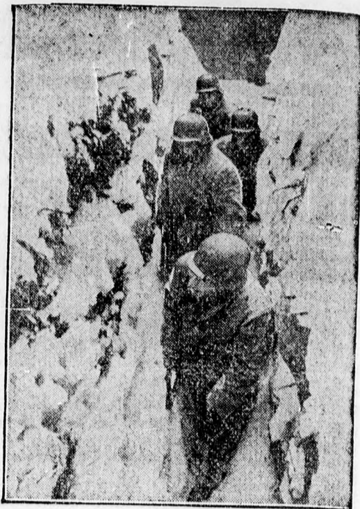
Behavazott állások a Feleség-Rajna mentén. Csak az őrszemek állnak kint, a csapatok az állásokban vannak

— Jegyek a fenti előadásra elővételben szerdától kezdődően már válthatók a színház baloldali elővételi pénztáránál 11—1-ig és 4—8-ig.